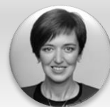
MUDr. Zdenka Němečková Crkvenjaš, MBA předsedkyně, Výbor pro zdravotnictví – Poslanecká sněmovna Parlamentu České republiky