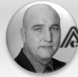
Ing. Zdeněk Kabátek ředitel, Všeobecná zdravotní pojišťovna České republiky