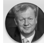
MUDr. Svatopluk Němeček, MBA ministr zdravotnictví v letech 2014 – 2016, Ministerstvo zdravotnictví České republiky; předseda představenstva, Bohumínská městská nemocnice, a.s.