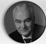
MUDr. Kamal Farhan stínový ministr zdravotnictví, poslanec, člen Výboru pro zdravotnictví, Poslanecká sněmovna Parlamentu České republiky