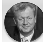
MUDr. Svatopluk Němeček, MBA ministr zdravotnictví v letech 2014 – 2016, Ministerstvo zdravotnictví České republiky; předseda představenstva, Bohumínská městská nemocnice, a.s.