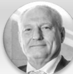
Ing. Zbyněk Pražák, Ph.D. náměstek primátora, statutární město Ostrava