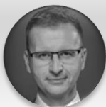
Ing. Radim Holíš hejtman, Zlínský kraj

ÚTERÝ 26. 11. 2024, STŘEDA 27. 11. 2024 – CLARION CONGRESS HOTEL PRAGUE – VYSOČANY