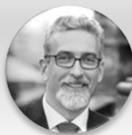
Mgr. Miroslav Žbánek, MPA primátor, statutární město Olomouc